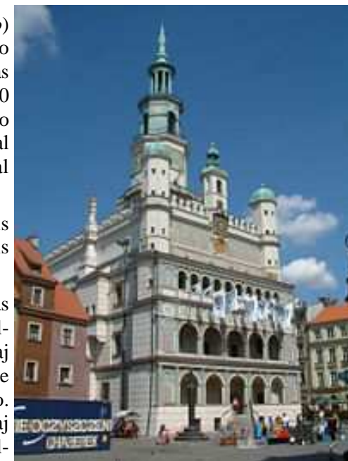
Urbodomo de Poznano

Tio tamen ne signifis nur mal-avantaĝojn. Ĝuste, la provinca situo